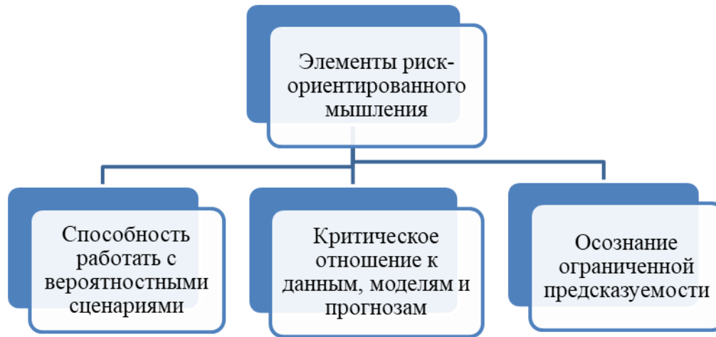
Рисунок 1. Элементы риск-ориентированного мышления

Если говорить о подготовке будущих экономистов, то риск-ориентированное мышление складывается из трёх основных элементов: