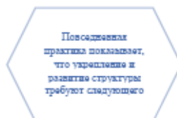
Рисунок 1. Идейные соображения высшего порядка

Задача организации, в особенности же постоянный количественный рост и сфера нашей активности играет важную роль в формировании систем массового участия.