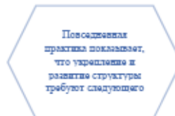
Рисунок 1. Идейные соображения высшего порядка

Задача организации, в особенности же постоянный количественный рост и сфера нашей активности играет важную роль в формировании систем массового участия.