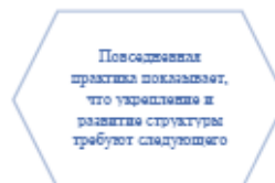
Рисунок 1. Идейные соображения высшего порядка

Задача организации, в особенности же постоянный количественный рост и сфера нашей активности играет важную роль в формировании систем массового участия.