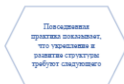
Рисунок 1. Идейные соображения высшего порядка

Задача организации, в особенности же постоянный количественный рост и сфера нашей активности играет важную роль в формировании систем массового участия.