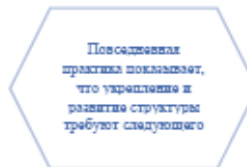
Рисунок 1. Идейные соображения высшего порядка

Задача организации, в особенности же постоянный количественный рост и сфера нашей активности играет важную роль в формировании систем массового участия.