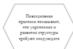
Рисунок 1. Идейные соображения высшего порядка

Задача организации, в особенности же постоянный количественный рост и сфера нашей активности играет важную роль в формировании систем массового участия.