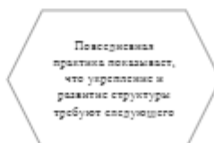
Рисунок 1. Идейные соображения высшего порядка

Задача организации, в особенности же постоянный количественный рост и сфера нашей активности играет важную роль в формировании систем массового участия.