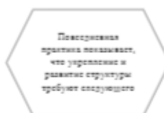
Рисунок 1. Идейные соображения высшего порядка

Задача организации, в особенности же постоянный количественный рост и сфера нашей активности играет важную роль в формировании систем массового участия.