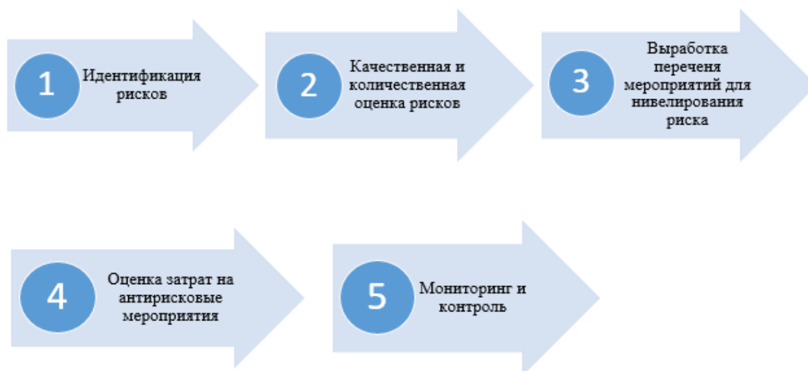
Рисунок 1. Этапы управления чрезвычайными рисками организаций (разработано авторами)

Этапы управления чрезвычайными рисками организаций представлены на рисунке 2.