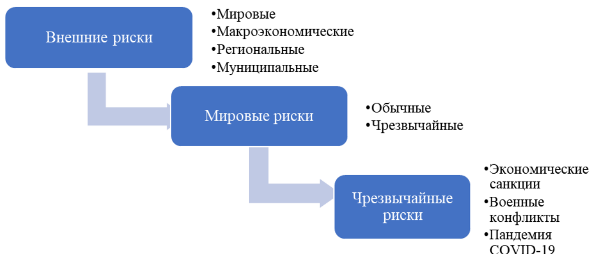
Рисунок 1. Место и виды чрезвычайных рисков в системе внешних экономических рисков организаций (разработано авторами)

Значительные риски имеют наибольшую вероятность непрогнозируемых ситуаций, связанных с прекращением бизнеса по объективным причинам мирового значения.