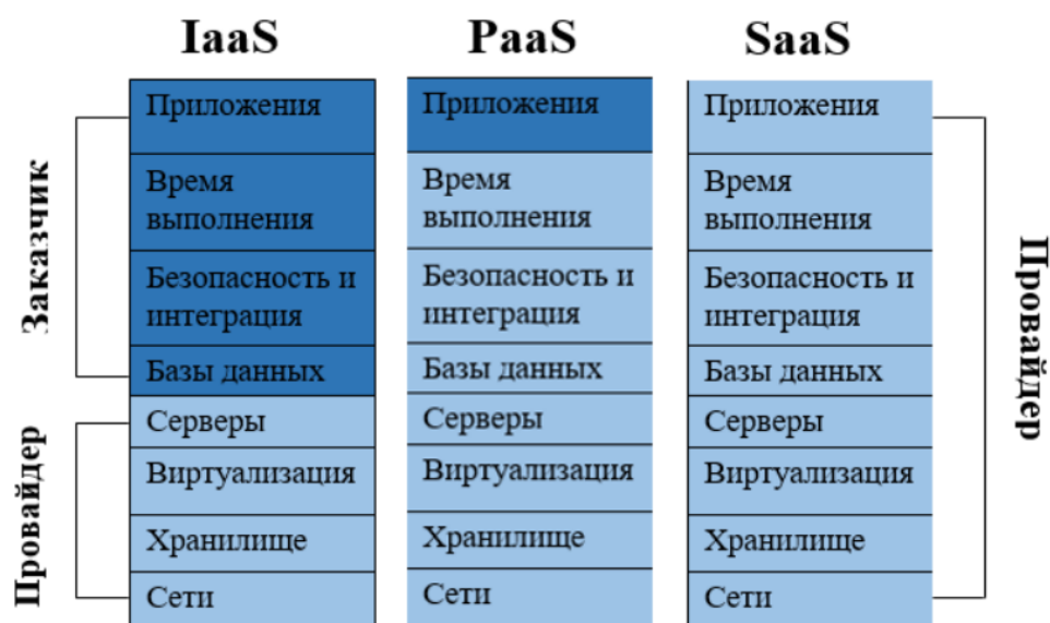
Рисунок 1. Модели облачных сервисов

Облачные вычислительные технологии включают в себя различные виды облачных услуг, рисунок 1: инфраструктуру как услугу (IaaS), платформу как услугу (PaaS) и программное обеспечение как услугу (SaaS). Каждый из этих видов услуг предоставляет определенный уровень функциональности для обработки данных.