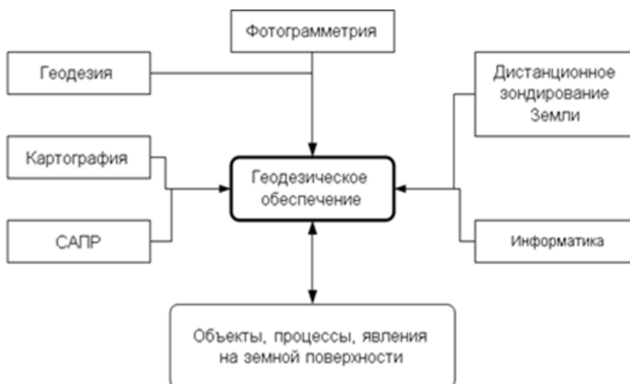
Рисунок 1. Источники геодезического обеспечения

Значительное место в процессе выбора показателей занимают оптимизационные задачи, в которых варианты решений сравниваются, и среди них находится наилучшее (оптимальное). Для того, чтобы сравнить альтернативные варианты. Выбрать среди них лучший, требуется, прежде всего, обеспечить их сопоставимость. Необходимо соблюдение определенных принципов, использованные определенным образом выбранных показателей геодезического обеспечения.