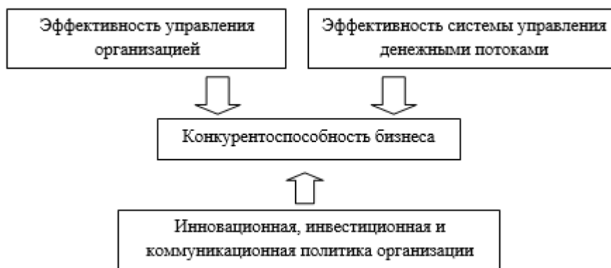
Рисунок 1 – Показатели, от которых будет зависеть уровень конкурентоспособность гостиничного бизнеса

удовлетворенностью покупателей характеристиками конечного продукта. Кроме того, в соответствии с рисунком 1, конкурентоспособность гостиничного бизнеса будет напрямую зависеть от качества следующих трёх показателей: