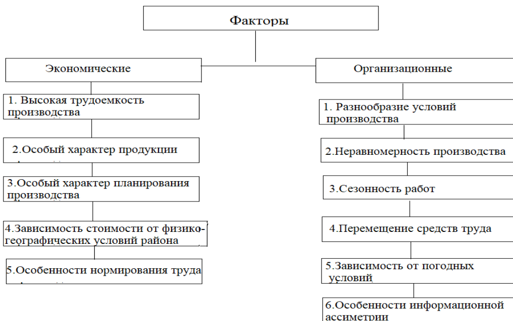
Рисунок 2. Факторы, влияющие на экономические показатели производства.

1. На устойчивость приборов и реек влияют сильный ветер и его влияние на них. Пыль и песчаные бури понижает видимость. Когда работа ведется на горных геодезических знаках, приходится вводить поправки безуспешно. Даже при сравнительно малой скорости этот сигнал приводит к качанию сигналов, что снижает точность измерений;