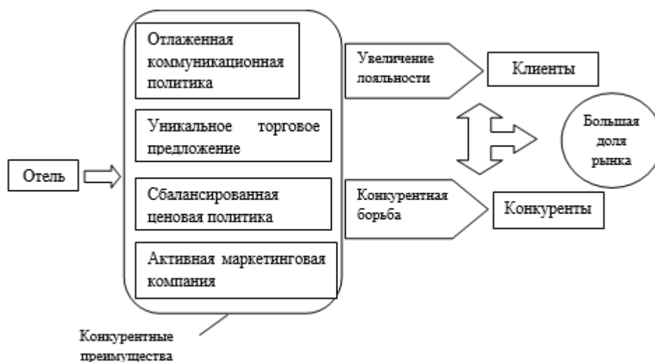
Рисунок 4 – Модель конкуренции на рынке гостиничных услуг

На основе исследования и систематизации научных взглядов и подходов к вопросам конкурентоспособности отеля на рынке нами была предложена модель, демонстрирующая, как гостиничное предприятие может соперничать со своими конкурентами (рисунок 4).