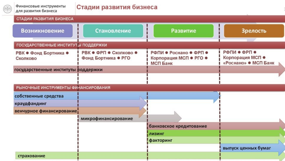
Рисунок 1 – Рыночные инструменты финансирования в зависимости от стадии развития бизнеса

В конце 2024 года Центральный банк РФ представил Дорожную карту по реализации основных направлений повышения доступности финансовых услуг в Российской Федерации на 2025-2027 годы, где одним из приоритетных направлений предусмотрено развитие финансирования субъектов МСП и повышение качества финансовых сервисов для бизнеса. Цель документа – сделать кредиты более доступными для малых и средних предприятий.