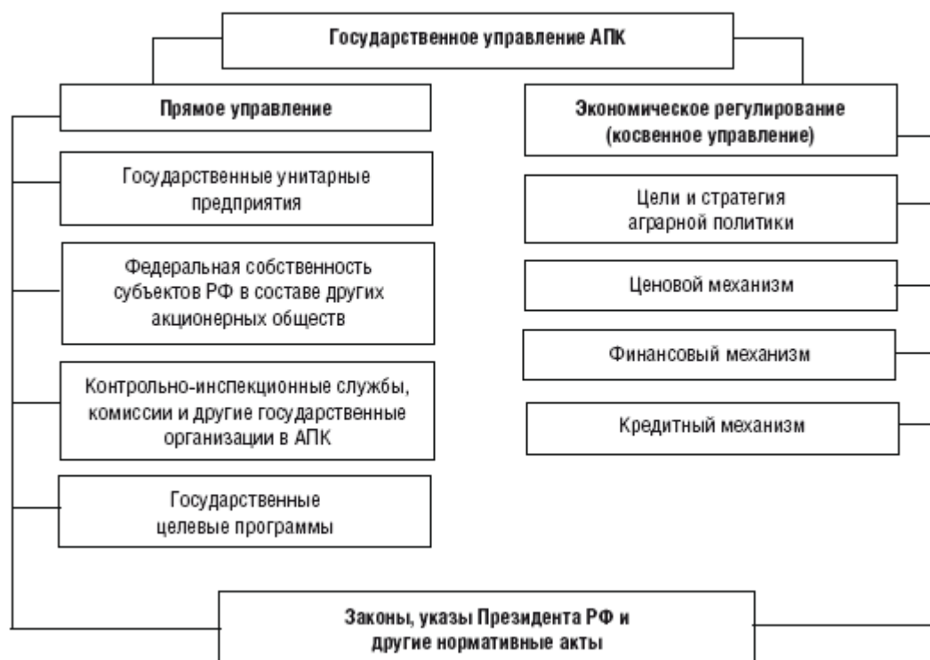
Рисунок 1 – Структура государственного управления АПК в Российской Федерации

Государственное управление АПК в Российской Федерации включает две ключевые подсистемы: прямое управление и экономическое регулирование (косвенное управление) (Рис. 1).