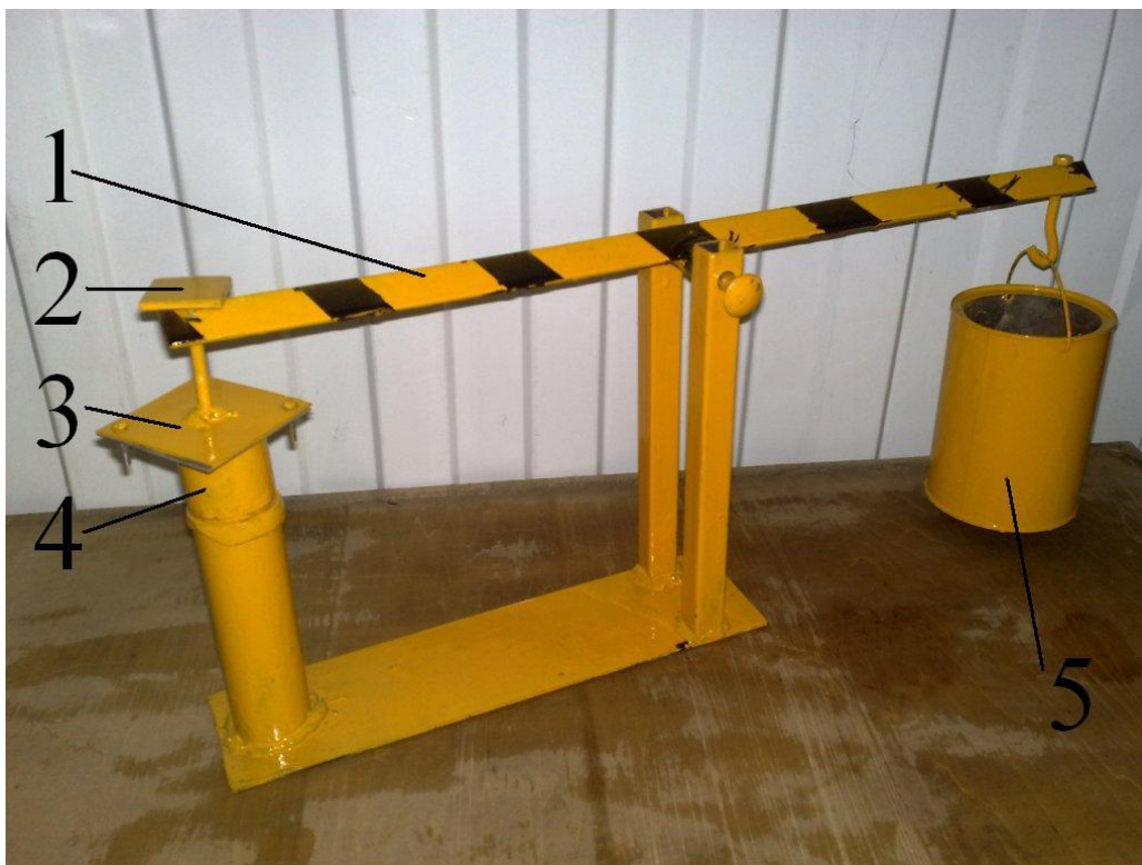
Рисунок 3. Прибор для измерения адгезии методом отрыва материала от грунта: 1 – рычаг, 2 – площадка для груза, 3 – пластинка стали, 4 – стакан для грунта, 5 – емкость для жидкости.

Заключение. Рассмотренные теории имеют различные объяснения природы адгезии связных грунтов с твердой поверхностью. Сторонники электромолекулярной теории утверждают, что адгезия обусловлена действием электромолекулярных сил в зоне контакта грунта с другими материалами. В то же время Корнет Э.А. утверждает, что под прилипанием следует понимать физический процесс, заключающийся во взаимодействии микрополостей поверхностей контактирующих тел, которое обусловлено действием вакуумных сил. Эти теории имеют свое теоретическое и экспериментальное подтверждение, следовательно, полученные различные выводы, возможно, говорят о недостаточной изученности такого явления природы, как адгезия влажных связных грунтов к твердым рабочим поверхностям. При помощи прибора для измерения адгезии (рис.3) в дальнейшем мы будем проверять какая из этих теорий более точнее и адекватнее.