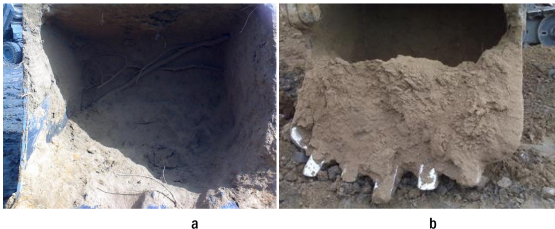
Рисунок 1(а,б). Налипание грунта на ковши экскаваторов

Различные организации занимаются разработкой способов и устройств для борьбы с налипанием, однако как показывает практика ни одно из них не работает эффективно, что говорит о недостаточной изученности вопроса и отсутствии надежной модели исследования процесса прилипания глиносодержащих веществ к поверхности твердых материалов [12].