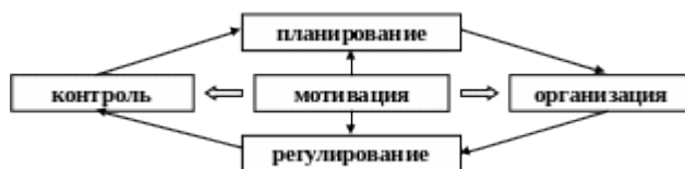
Рис. 1. Цикл менеджмента

В процессном подходе менеджмент рассматривается как совокупность последовательно сменяющих друг друга действий, представляющих собой непрерывный процесс. Эти действия называют функциями управления. Под функциями управления понимаются специфические, обособленные виды деятельности, обладающие единством цели, характера выполняемых работ и операций, направленные на определенную часть управляемого объекта для достижения поставленной цели. При описании процесса управления выделяют пять основных групп функций управления: планирование; организация; регулирование (координация, руководство); мотивация; контроль (учет, анализ). Процесс управления является динамичным, циклическим комплексом, который в литературе по менеджменту называют циклом менеджмента (рис. 1).