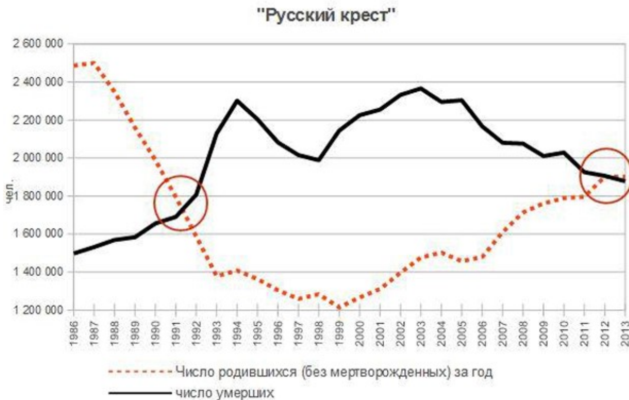
Рисунок 1. «Русский крест»