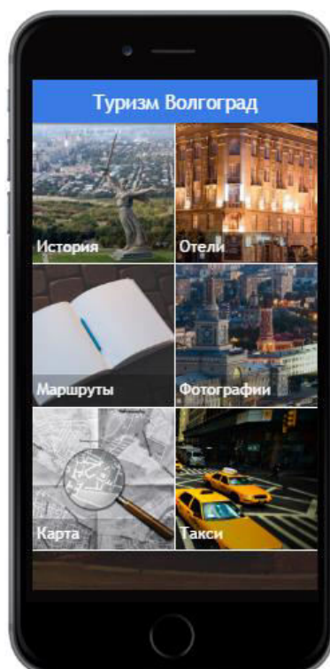
Рисунок 1. Главное меню мобильного приложения «Туризм Волгоград»

На рисунке 1 представлен вид главного меню мобильного приложения.