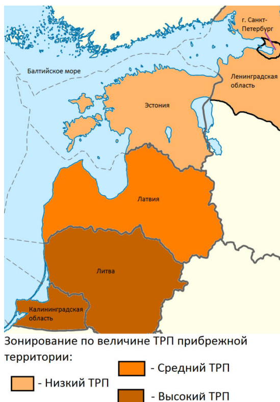
Рисунок 3. Зонирование по величине туристско-рекреационного потенциала прибрежной зоны Балтийского моря

Высокий туристско-рекреационный потенциал наблюдается на прибрежной территории Калининградской области и Литвы. Основными причинами этого являются более благоприятный климат, по сравнению с остальным рассматриваемым районом прибрежной полосы Балтийского моря, а также более привлекательной и доступной ценой на лечение в местных санаториях. Низкий ТРП наблюдается на территории Ленинградской области и Эстонии. В Ленинградской области причинами этого служат плохое состояние санаторно-курортной инфраструктуры и относительно неблагоприятные климатические показатели. Эстония находится в аутсайдерах по причине высоких цен на санаторно-курортные услуги.