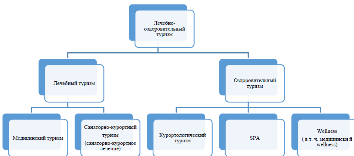
Рисунок 2. Лечебно-оздоровительный туризм по С.Л. Мозокиной

По такому же принципу можно разграничить санаторно-курортный туризм и курортологический туризм. В первом случае предполагается нахождение туриста на территории санатория или курорта, как правило, 21 день (в зависимости от предписания врача). Второе же понятие подразумевает под собой добровольное желание туриста для оздоровления посетить благоприятную для этого местность.