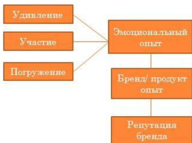
Рисунок 1. Основные цели ивент-маркетинга

Гостиничная индустрия имеет ряд особенностей продвижения услуг, к которым можно отнести субъективность восприятия их качества, часто непрямой выход на конечного потребителя, а также необходимость формирования кампании для разных типов клиентов. Эффективным инструментом для визуализации услуг гостиницы будет являться ивент-маркетинг. Под ивент-маркетингом понимается организация мероприятий, нацеленных на продвижение компании и ее услуг с помощью интересных и запоминающихся событий, направленных на эмоциональный контакт с аудиторией. Основные цели ивент-маркетинга в отеле - не только продвижение его бренда и услуг, но и, что немаловажно, повышение лояльности клиентов.