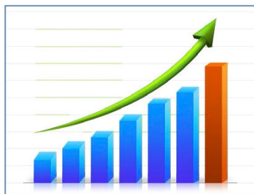
Рисунок 1. Название рисунка

Текст статьи. Текст статьи. Текст статьи. Текст статьи. «Цитата» [2, с. 16]. Текст статьи. Текст статьи. Текст статьи. Текст статьи.