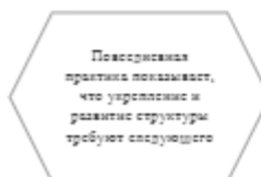
Рисунок 1. Идейные соображения высшего порядка

Задача организации, в особенности же постоянный количественный рост и сфера нашей активности играет важную роль в формировании систем массового участия.