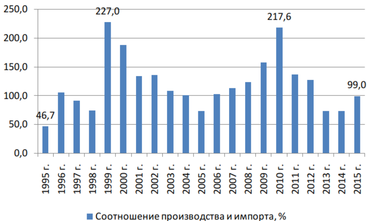
Рисунок 1. Соотношение производства и импорта вин в России за 1995-2015 годы