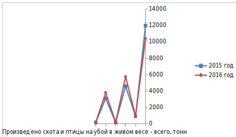
Таблица 1. Сводные данные по крестьянским (фермерским) хозяйствам и индивидуальным предпринимателям Рязанской области

Из сводных данных по крестьянским (фермерским) хозяйствам и индивидуальным предпринимателям Рязанской области приведенных в таблице 1 видно, что производство хозяйств и индивидуальных предпринимателей Рязанской области развивается достаточно стабильно. Так, в 2016 году в процентном соотношении в 2015 году произведено скота и птицы на убой в живом весе в тоннах 105,9 %, надой молока 123,0 % в литрах, яиц получено 111,9 % поштучно. поголовье скота и птицы, в том числе крупный рогатый скот 125,4%, в том числе коровы 137,2 %, свиньи 104,3 %, овцы и козы 86,7 % голов. поголовье овец и коз сократилось, но в целом производство хозяйств немного улучшило свои показатели, по сравнению с прошедшим 2015 годом. Потенциал к дальнейшему развитию домашних хозяйств очевиден и при должной поддержке государственных властей наращивание производства становится вполне выполнимой задачей.