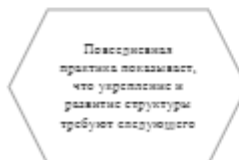
Рисунок 1. Идейные соображения высшего порядка

Задача организации, в особенности же постоянный количественный рост и сфера нашей активности играет важную роль в формировании систем массового участия.