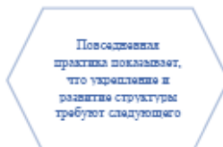
Рисунок 1. Идейные соображения высшего порядка

Задача организации, в особенности же постоянный количественный рост и сфера нашей активности играет важную роль в формировании систем массового участия.