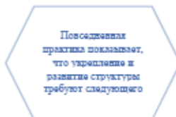
Рисунок 1. Идейные соображения высшего порядка

Задача организации, в особенности же постоянный количественный рост и сфера нашей активности играет важную роль в формировании систем массового участия.