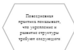
Рисунок 1. Идейные соображения высшего порядка

Задача организации, в особенности же постоянный количественный рост и сфера нашей активности играет важную роль в формировании систем массового участия.