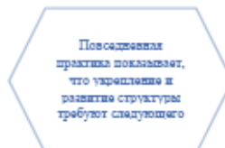
Рисунок 1. Идейные соображения высшего порядка

Задача организации, в особенности же постоянный количественный рост и сфера нашей активности играет важную роль в формировании систем массового участия.